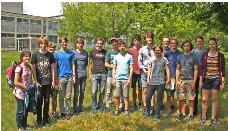
Gewinner der Regionalrunde der mitteldeutschen Landesolympiaden, Juni 2019

Im Herbst 2019 wird in Leipzig wieder die vierte Runde – die Bundesrunde – stattfinden, in welcher die drei Gewinner der drei Regionalrunden antreten, um die besten deutschen Schülerinnen und Schüler der Klassenstufen 9 und 10 zu finden. Es wird wiederum eine theoretischen Klausur sowie einen praktischen Experimentierteil geben.